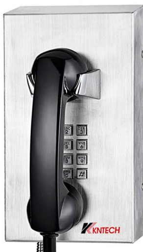
VOIP KNZD-10 不锈钢电话机